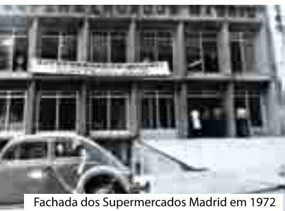
Fachada dos Supermercados Madrid em 1972